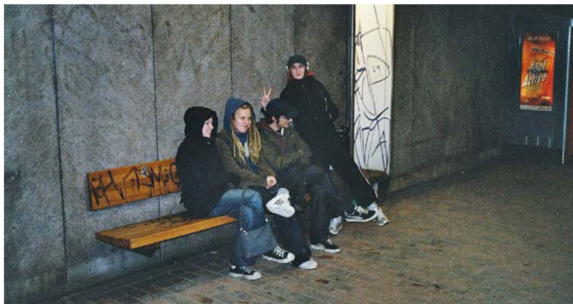
Bild ur filmen Trafikljusen blir blå imorgon .