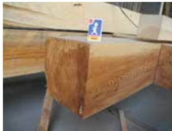
Skulpturen sammanfogas av massivt trä, fura eller gran, med en tjocklek på 200x200 millimeter. Kallade sparrar.