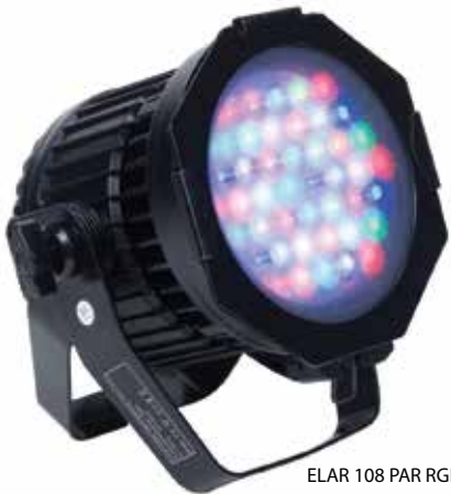
ELAR 108 PAR RGBW

Båda armaturtyperna, lamporna, är programmerbara (DMX) för en fast ljussättning, scen, eller spektakulära ljusspel vid tillfälliga evenemang i Fisksätra. Montage sker på befintliga stolpar.