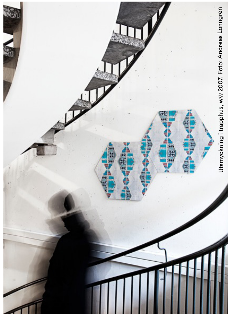
Utsmyckning i trapphus, ww 2007.