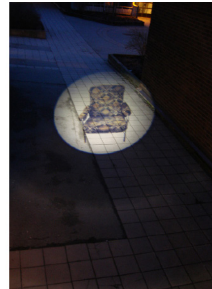
Konstnärssduon ww:s belysning till Fisksätra allé. Gobo-projektorer visar motiv från Fisksätra mönsterarkiv - här träskor och en fåtölj.